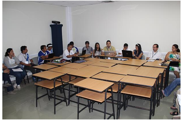
Reunión por regiones, aplicando aspectos del momento JUGAR México y Centroamérica