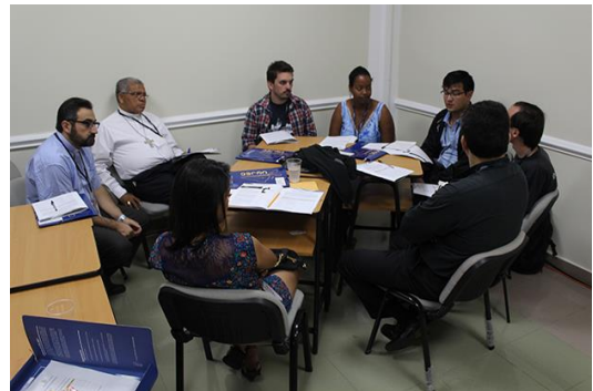
Región Cono Sur